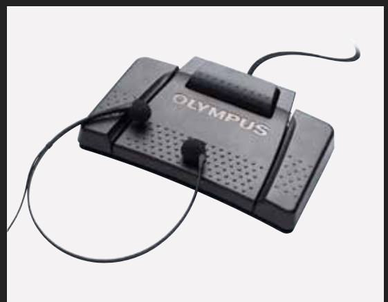
AS-9000 beinhaltet RS-31H, E-102, ODMS Transkriptions-Modul (Einzel Lizenz)

Das ODMS Transkriptions-Modul bietet eine nahtlose Schnittstelle zur Dragon NaturallySpeaking* Software. Durch den Einsatz der Spracherkennung wird die erforderliche Zeit für die Transkription Ihrer Diktate wesentlich verringert.