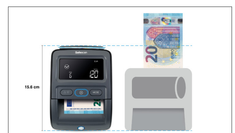
Hat im Vergleich zu anderen Produkten auf dem Markt eine der kleinsten verfügbaren Betriebsflächen