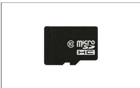
Safescan Micro SD Karte Art. no: Verschiedene (je nach Gerät und Währungen)