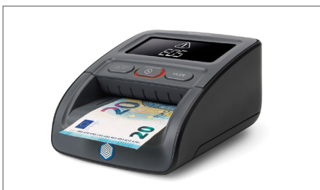
Prüft Banknoten auf bis zu sieben Sicherheitsmerkmale